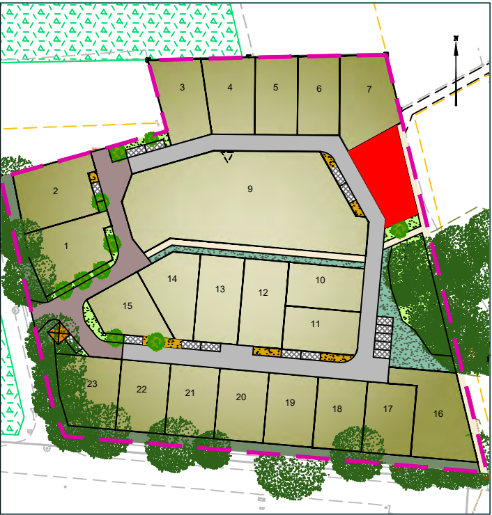
Plan de situation (sans échelle)

Article L115-4 du Code de l'Urbanisme: "Toute promesse unilatérale de vente ou d'achat, tout contrat réalisant ou constatant la vente d'un terrain indiquant l'intention de l'acquéreur de construire un immeuble à usage d'habitation ou à usage mixte d'habitation et professionnel sur ce terrain mentionne si le descriptif dudit terrain résulte d'un bornage. Lorsque le terrain est un lot de lotissement, est issu d'une division effectuée à l'intérieur d'une zone d'aménagement concerté par la personne publique ou privée chargée de l'aménagement ou est issu d'un remembrement réalisé par une association foncière urbaine, la mention du descriptif du terrain résultant du bornage est inscrite dans la promesse ou le contrat.." - Les constructeurs, architectes et dépositaires de permis de construire devront s'assurer au préalable de l'existence et de la position des réseaux sur le terrain, ou en demandant les plans de recollement au maître d'ouvrage. - Il est obligatoire pour chaque acquéreur de faire implanter sa construction principale par le Géomètre-Expert auteur du projet et faire vérifier le bornage de son lot à ses frais.