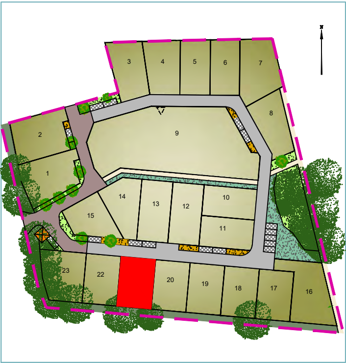
Plan de situation (sans échelle)

Article L115-4 du Code de l'Urbanisme: "Toute promesse unilatérale de vente ou d'achat, tout contrat réalisant ou constatant la vente d'un terrain indiquant l'intention de l'acquéreur de construire un immeuble à usage d'habitation ou à usage mixte d'habitation et professionnel sur ce terrain mentionne si le descriptif dudit terrain résulte d'un bornage. Lorsque le terrain est un lot de lotissement, est issu d'une division effectuée à l'intérieur d'une zone d'aménagement concerté par la personne publique ou privée chargée de l'aménagement ou est issu d'un remembrement réalisé par une association foncière urbaine, la mention du descriptif du terrain résultant du bornage est inscrite dans la promesse ou le contrat.." - Les constructeurs, architectes et dépositaires de permis de construire devront s'assurer au préalable de l'existence et de la position des réseaux sur le terrain, ou en demandant les plans de recollement au maître d'ouvrage. - Il est obligatoire pour chaque acquéreur de faire implanter sa construction principale par le Géomètre-Expert auteur du projet et faire vérifier le bornage de son lot à ses frais.