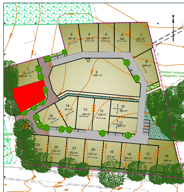
Plan de situation (sans échelle)

LOT N° : 1 Superficie provisoire : 430 m 2 (en attente du bornage)