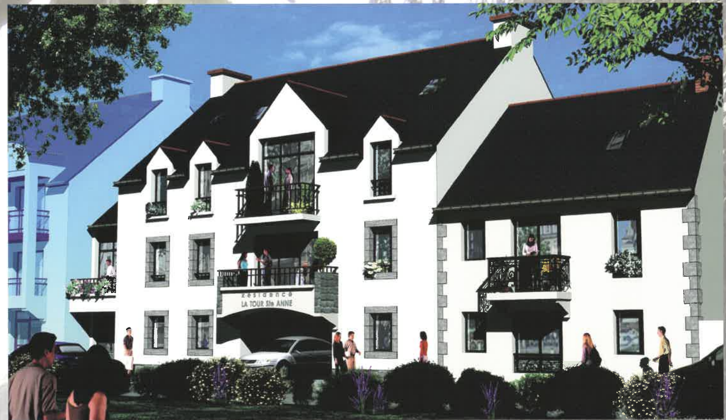
Architecte DPLG : Jean-Paul BLANCHARD - LA BAULE ESCOUBLAC

Ville en plein essor, elle sait allier le charme de ses petites ruelles pavées, de ses échoppes modernes aux enseignes en fer forgé et le dynamisme économique.